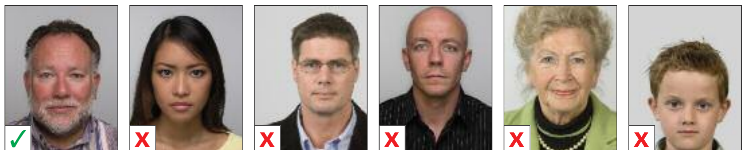
BUENA A. No centrada B. No centrada C. Demasiado arriba D. Demasiado arriba E. Demasiado abajo