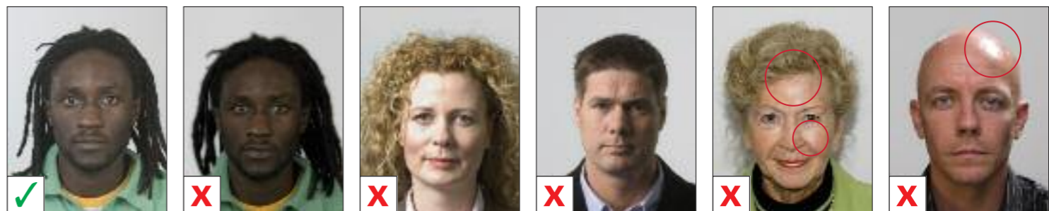
BUENA A. Subexpuesta B. Sobreexpuesta C. Sombra en el rostro D. Reflejos E. Reflejos (manchas blancas)