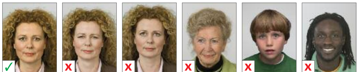
BUENA A. No es una mirada neutra B. No está mirando directamente a la cámara C. No está mirando directamente a la cámara D. La boca no está cerrada E. La boca no está cerrada