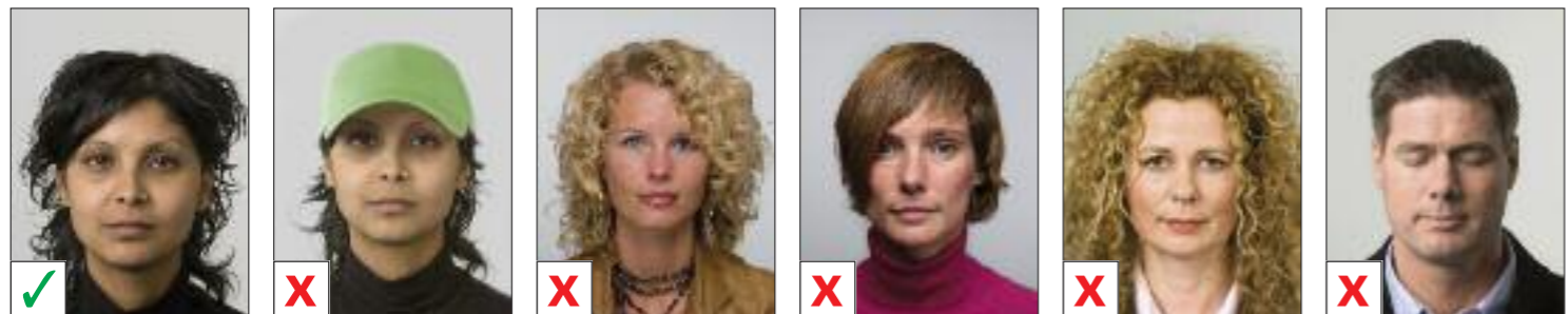
BUENA A. La cabeza cubierta B. El rostro no está totalmente visible C. El rostro no está totalmente visible D. El rostro no está totalmente visible E. Los ojos no están totalmente visibles