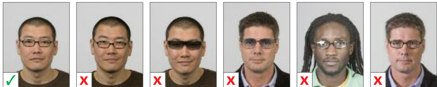
BUENA A. Ojos no visibles completamente B. Cristal tintado C. Cristal tintado D. Reflejos E. Sombra de las gafas