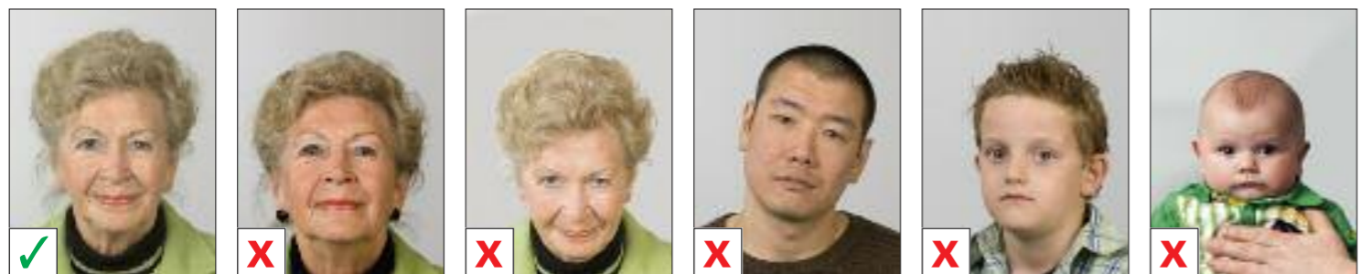
BUENA A. Hacia atrás B. Hacia adelante C. Inclinada D. A un lado y los hombros no rectos E. Apoyo visible